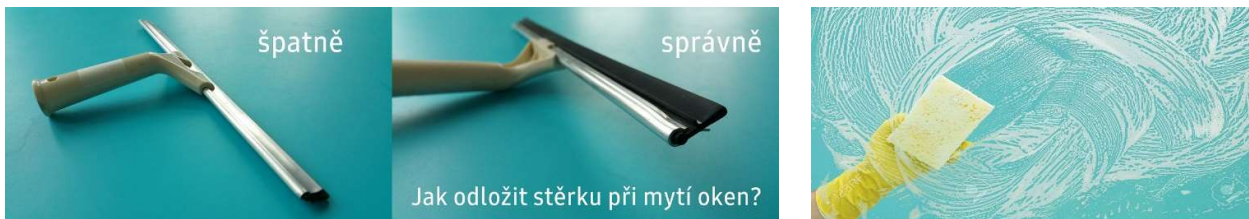
mytí oken stěrkou