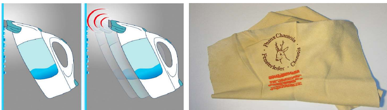
mytí oken elektrickým čističem