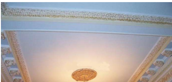
Stropní sádrokarton s dekorativními prvky

Barevné rozdělení sádrokartonových desek podle způsobu použití