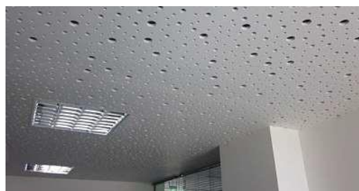
Akustické děrované stropní desky