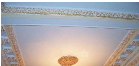
Stropní sádrokarton s dekorativními prvky

Barevné rozdělení sádrokartonových desek podle způsobu použití