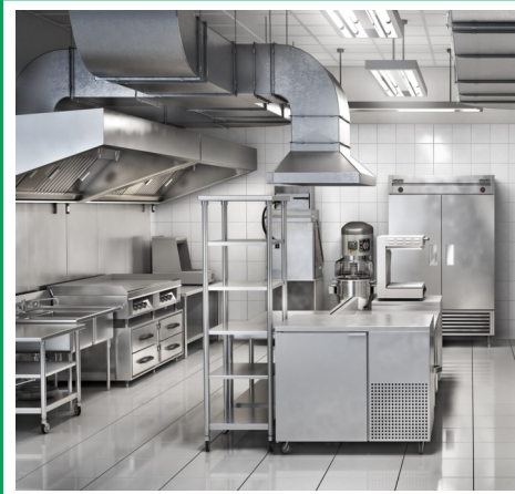
ZELENÁ = KUCHYŇSKÁ OBLAST