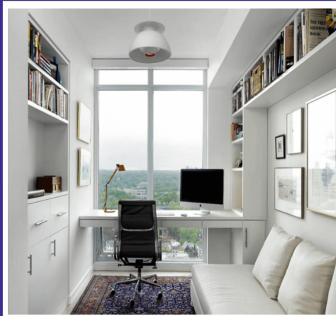
MODRÁ = GENERÁLNÍ OBLAST