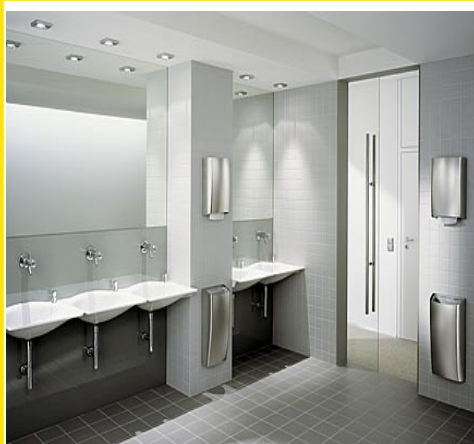
ŽLUTÁ = UMÝVÁRENSKÁ OBLAST